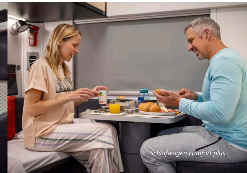
Schlafwagen comfort plus